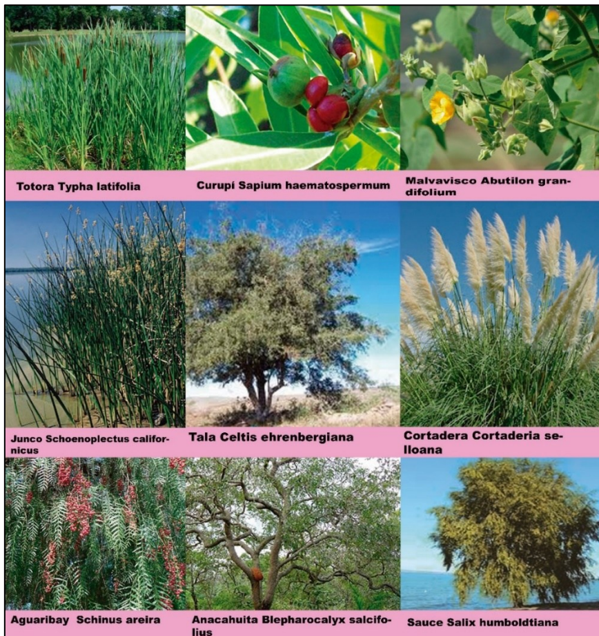
Figura 5. Imágenes de las especies encontradas en el muestreo visual.

Se concluyó como el Área menos impactada por el desarrollo de la traza de la ruta, con más presencia de elementos nativos (en la Figura 5 se muestran imágenes de las nativas resultantes). De todos modos, denota algún grado de intervención con respecto al paisaje original de islas.