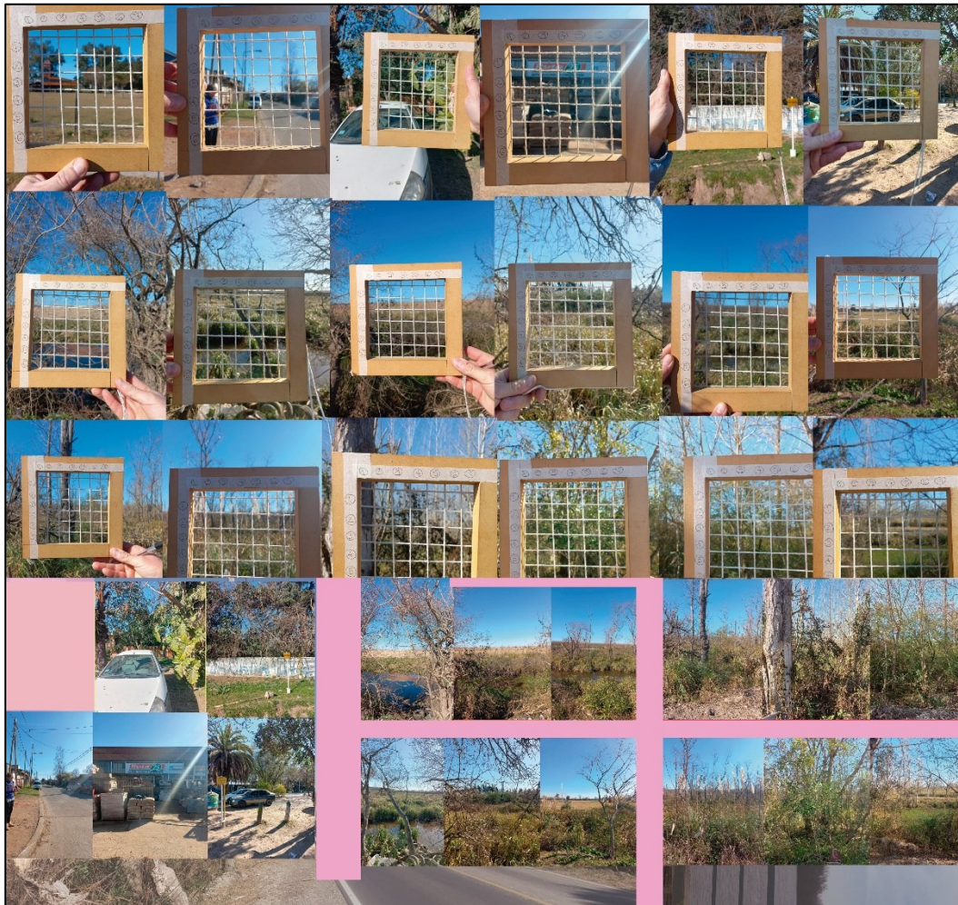
Figura 3. Muestreo con grilla o matriz de observación visual. De arriba hacia abajo A1, A2 y A3