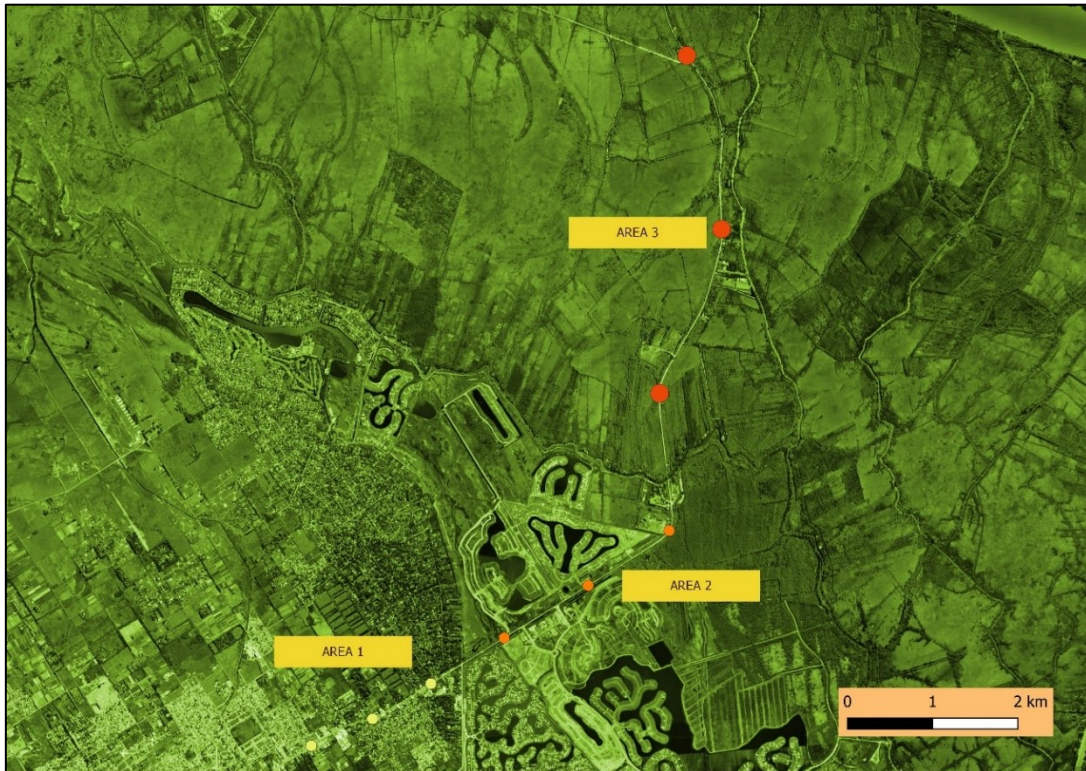
Figura 2. Diseño de muestreo visual. Tres áreas con tres estaciones de muestreo cada una.

En cada estación se realizó la toma o el muestreo visual. Constó en la aplicación, como muestra la figura 3, de una grilla de 18 *18 cm dividida en cuadrados de 3*3 cm. Así se estableció una matriz de observación de 6 * 6 cuadraditos o unidades de análisis. Luego en cada unidad de análisis se estimó la especie preponderante a escala visual humana, tomando el mismo muestreador cada vez para no incorporar sesgo o error.